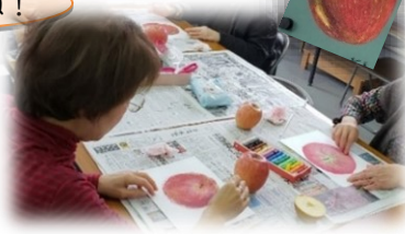
りんごを描くアート作品