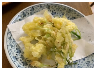
藤の花の天ぷら 白い藤の花は食用になります。